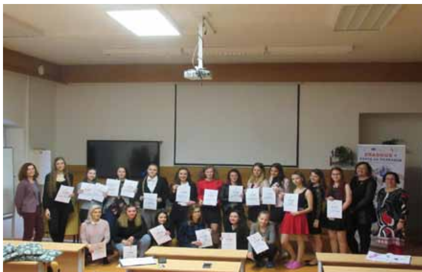
Školní kolo soutěže z Ošetřovatelství

Žáci třetích a čtvrtých ročníků soutěžili se svými prezentacemi v Ošetřovatelství, soutěž je nazvána „Moje nejzajímavější kazuistika“. Vzhledem k pandemii Covid – 19 se další postupová kola neuskutečnila, i když byla naplánována.