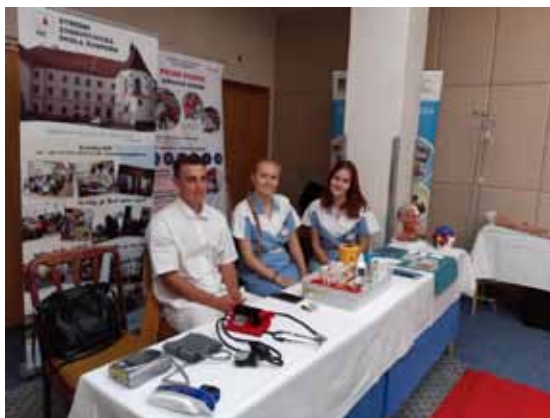
Burza práce Šumperk.

Každoročně představujeme naši školu na Burze práce v Šumperku. Letošní ročník byl inovován o účast v tzv. „Živé knihovně“, kde jsme měli možnost představit naši školu společně s Nemocnicí Šumperk. Prezentace byla zahájena poutavým videem Nemocnice Šumperk, představením naší školy a poté praktickými ukázkami první pomoci - resuscitace novorozence, většího dítěte a dospělého, seznámení s defibrilátorem, péče o novorozence a spoustu dalších ukázek z výuky Ošetrovatelské péče. Žákům 9. ročníků tak byla dána možnost blíže nahlédnout do problematiky zdravotnictví.