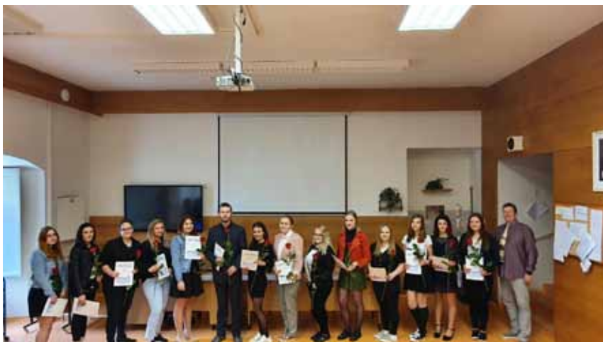
Třída ZA 4. B