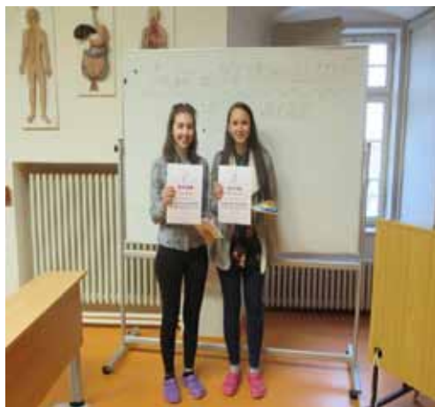
Výherkyně „Moje nejzajímavější kazuistika“