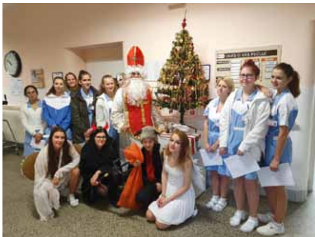
Mikulášská besídka v Nemocnici Šumperk.