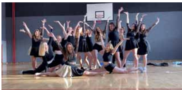
Vítězství třídy 3.B v taneční soutěži.

Pohybové a taneční schopnosti žáků byly rozvíjeny v taneční soutěži jednotlivých tříd. Vítězskou třídou se stali žáci 3.B, kteří nás měli reprezentovat v celorepublikovém kole soutěže s oficiálním názvem „ Česko se hýbe ve školách plných zdraví “ (vyhlášené MŠMT), které se z důvodu uzavření škol a zrušení akcí neuskutečnilo.