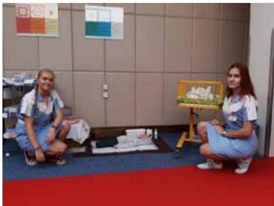
Burza práce Šumperk.

VP navázala kontakty s výchovnými poradci mnoha základních škol , kteří nám umožnili navštívit žáky 9. ročníků přímo ve vyučování nebo na rodičovském sdružení. Žákům byla nejen představena naše škola a obor Praktická sestra, ale byl ponechán také prostor pro besedu s žáky na téma zdraví, nemoc, schopnost empatie a význam mezilidských vztahů. Podařilo se nám navštívit ZŠ Postřelmov, Bludov, Šumperk, Mohelnice, Hanušovice, Zábřeh, Uničov a Litovel.