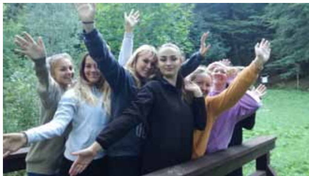
Seznamovací kurz 1. ročníků Švagrov.

Celkově byl seznamovací kurz hodnocen žáky a pedagogy pozitivně, a proto v jeho organizování budeme v následujícím školním roce pokračovat.