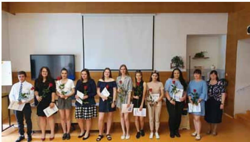
Třída ZA 4. A

Výřazení absolventů proběhlo na naší škole v učebně somatologie 16. 6. a 22. 6. 2020: