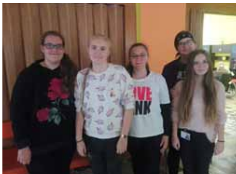
Mazaný Filip v Domově pro seniory Šumperk

V rámci projektu „Prohloubení kvality vzdělávání na SZŠ Šumperk II“, CZ.02.3.X/0.0/0.0/18_065/0013803 jsme v letošním školním roce rozšířili praktickou výuku o nové pracoviště, tři oddělení v Domově pro seniory v Šumperku. V rámci odborné praxe ve 3. ročníku jsme posílili výuku ještě o další dvě pracoviště, které jsme vybrali dle spádové oblasti žáků, a to Zábřeh a Jeseník. Žáci si procvičili odborné dovednosti, rozšířili si náhled na pracoviště v okolí svého bydliště. Oblasti bydliště žáků jsme vybrali záměrně, neboť je zde reálná možnost, že při pozitivních zkušenostech v těchto „domácích“ zařízeních zůstanou v kraji, kde se narodili.