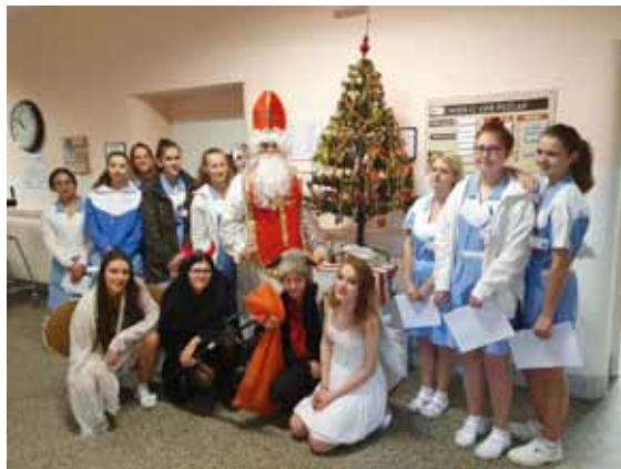
Naši žáci v podobě Mikuláše, čerta a anděla v Nemocnici Šumperk.

Zapojením našich žáků do dobrovolných sbírek se snažíme o jejich motivaci k nezištné pomoci ostatním, k rozvoji altruismu a dalších pozitivních vlastností nezbytných pro práci zdravotníka. Pomáhali jsme se sbírkami: charitativní akce Bílá pastelka, Srdíčkový týden, sbírka pro Armádu spásy, Vánoční hvězda, sbírka plastových víček aj..