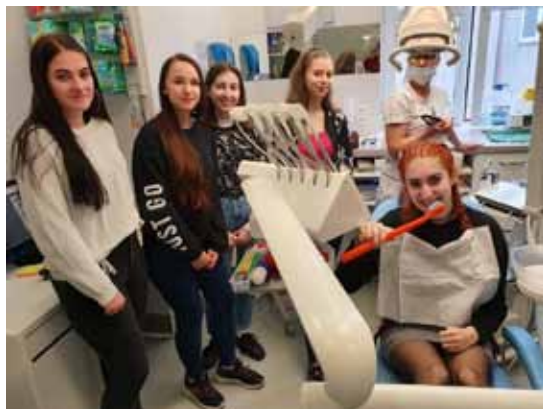
Workshop dentální hygiena.

s konkrétními pracovníky a některé činnosti si mohli i vyzkoušet. Díky spolupráci se zaměstnavateli žáci získali informace o možnostech uplatnitelnosti na trhu práce. Tato aktivita je zaměřena na snížení počtu předčasných odchodů ze zaměstnání. Uvědomujeme si význam tohoto projektu a jsme rádi, že ho můžeme realizovat v kooperaci se zaměstnavateli v našem regionu.