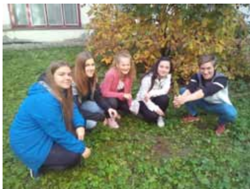
Projekt Krokus 2019.

Za připomenutí stojí také projekt Krokus 2019, kterým přibližujeme mladým lidem tematiku holocaustu.