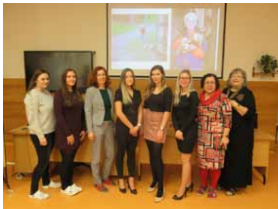
Školní kolo Olympiády z psychologie

Výherci, budou bojovat v regionálním kole, v pozměněném čase, na naší škole na podzim 2020.