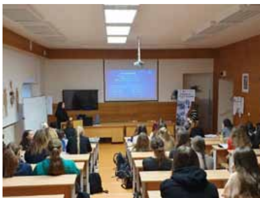
Studentská konference Ošetřovatelství.

V průběhu školního roku 2019/20 vyučující analyzovali schopnosti a dovednosti všech žáků. Zvýšená pozornost byla věnována zejména žákům 1. ročníků. Prozatím jsme nezaznamenali žáka s mimořádným nadáním, ale u některých žáků se projevoval zvýšený potenciál v oblasti vědomostí a dovedností v některých předmětech. Tento potenciál žáků jsme podporovali a snažili se je motivovat k aktivní účasti na soutěžích, jak ve všeobecně vzdělávacích předmětech, tak i v odborných. Žáci se účastnili školního kola Psychologické olympiády a studentské konference z Ošetřovatelství, kde prezentovali své ošetřovatelské kazuistiky, Bohužel z důvodu uzavření škol se nekonala soutěž ze Somatologie a Klinické propedeutiky. Ani vítězná dvojice ze školního kola Ošetřovatelství nemohla předvést svůj výkon na XVI. ročníku Festivalu ošetřovatelských kazuistik ve Zlíně. Dále se žáci účastnili okresního kola soutěže v anglickém jazyce, recitačních soutěží (Wolkerův Prostějov – krajské kolo uměleckého přednesu).