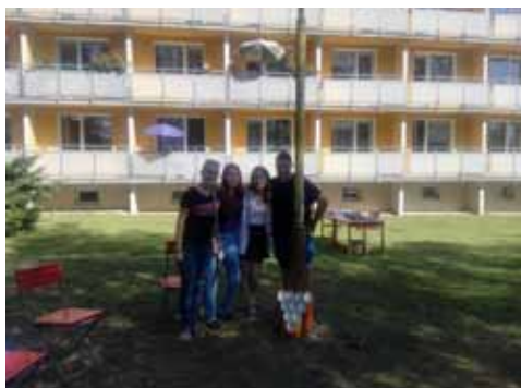
Sportovní hry v Domově pro seniory Šumperk

Dlouhodobě spolupracujeme s Transfúzní stanicí Šumperk, která je součástí skupiny Agel - společně darujeme krev.