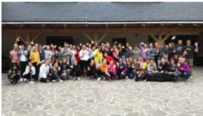
Seznamovací kurz 1. ročníků Švagrov.

V rámci zpětné vazby od žáků vypracovala výchovná poradkyně (dále jen VP) anonymní dotazník k hodnocení seznamovací akce 1. ročníků. Akce se zúčastnilo 58 žáků. Téměř většina žáků (98%) uvedla, že během kurzu panovaly mezi spolužáky kamarádské vztahy . Všichni přítomní žáci pozitivně zhodnotili prostředí , kde akce probíhala a většina žáků by seznamovací kurz doporučila budoucím žákům 1. ročníků. Stravování bylo hodnoceno pozitivně a to celkem u 91% respondentů. Zde došlo k výraznému zlepšení ve srovnání s předešlými ročníky. 84% žáků bylo spokojeno i s ubytováním. S prostředím, kde seznamovací kurz probíhal byla spokojenost téměř 100%. Mezi nejoblíbenější a nejlepší aktivity zařadili žáci diskotéku ( 53% ), dále noční stezku odvahy a společenské hry. Nejméně oblíbenými činnostmi byly aktivity týkající se problematiky ekologie, kterou by 51% přítomných žáků zhodnotilo tak, že by danou aktivitu již nechtěli opakovat.