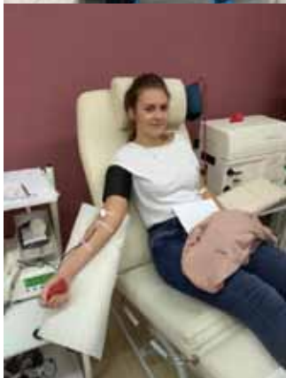
Společné darování krve na Transfúzní službě v Šumperku

Během celého školního roku probíhá projekt „Prohloubení kvality vzdělávání na SZŠ Šumperk II“, CZ.02.3.X/0.0/0.0/18_065/0013803, který v rámci jedné šablony umožňuje žákům prohlédnout různá zdravotnická pracoviště v našem regionu. Ve spolupráci s potencionálními zaměstnavateli formou workshopů a přednášek odborníků z praxe žáci získávají informace z reálného prostředí, které pak využijí při výběru svého budoucího pracoviště. Tato aktivita je zvolena se záměrem rozšíření obzoru žáků v oblasti zaměstnání a zlepšení jejich uplatitelnosti na trhu práce.