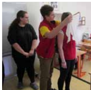
Kurzy první pomoci pro veřejnost 2020

Návštěvníky našich kurzů byli lidé ze Šumperka i širokého okolí. Přicházeli manželské nebo partnerské páry, rodiče s dětmi, přátelé, ale i jednotlivci. Někteří přijdou jednou a příště už nás nenavštíví, jiní jsou vytrvalí a projdou s námi všemi kurzy. Letos jsme zaznamenali 46 takových věrných účastníků, kteří absolvovali sérii všech tří kurzů.