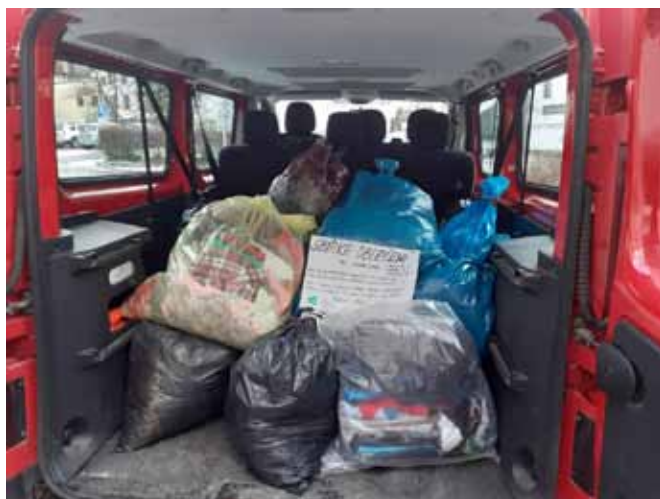
Sbírka pro Armádu spásy

Na podzim jsme společně darovali krev na Transfúzní službě v Šumperku, do této záslužné akce se hrdě zapojili zletilí žáci 3. a 4. ročníků.