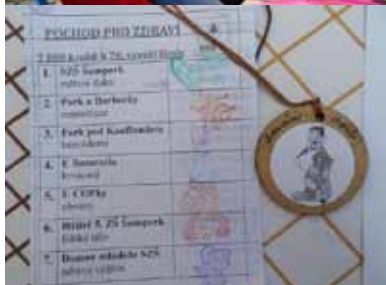
7 tisíc kroků pro zdraví