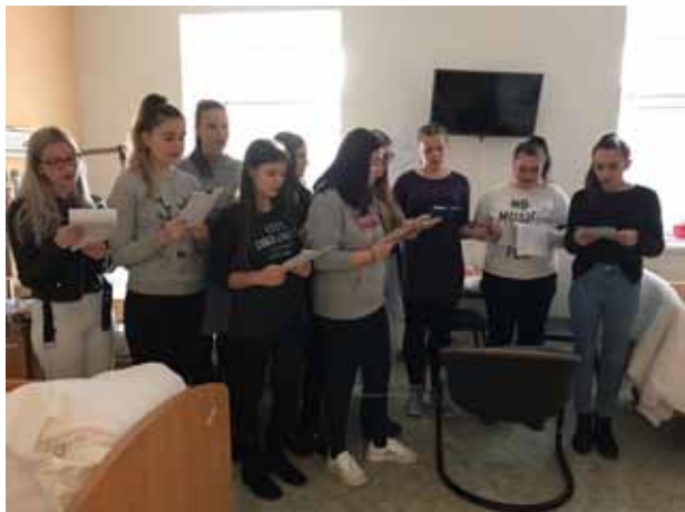
Vánoční besídka na Interně v Zábřehu