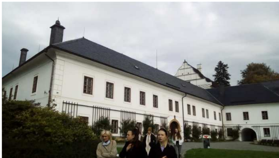
Projektový týden 4. ročníků

Žáci 4. ročníku byli informováni o termínu konání Evropského veletrhu pomaturitního a celoživotního vzdělávání Gaudeamus v Olomouci , který se bohužel nakonec z důvodu pandemie covid 19 neuskutečnil.