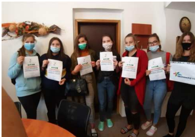
Ekologická konference 1. a 2. ročníků

Stalo se již samozřejmostí, že naše škola organizuje dobrovolné dárcovství krve . V letošním školním roce se nám bohužel z důvodu uzavření škol nepodařilo dárcovství zorganizovat. Snaha pedagogů o motivaci žáků k dárcovství byla vynaložena alespoň v rámci distanční výuky v online hodinách. Někteří pňnoletí žáci se rozhodli darovat krev individuálně. Dobrovolným dárcovstvím se snažíme žáky vést k odpovědnosti za vlastní život i životy druhých.