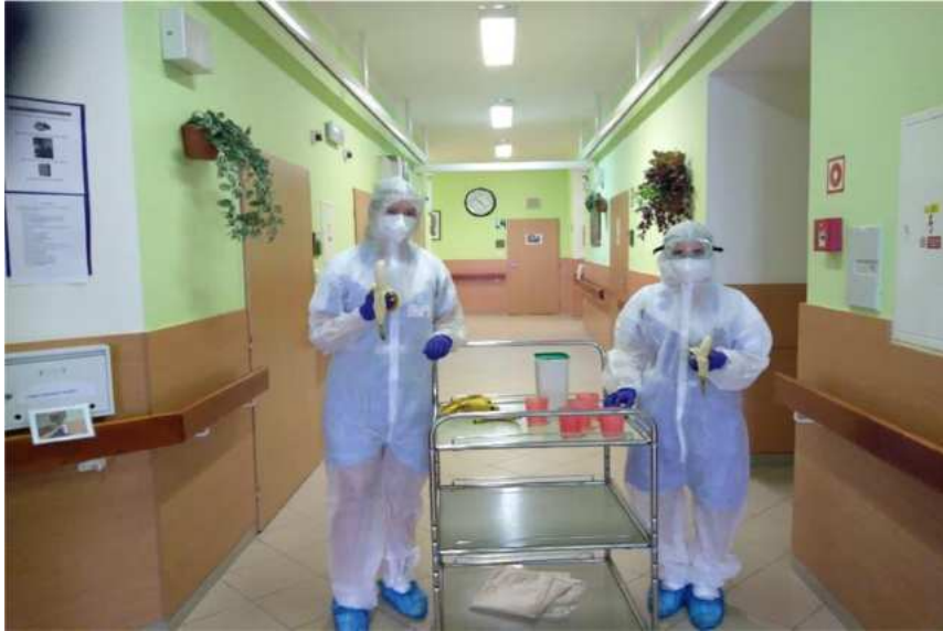
Domov se zvláštním režimem v Jedli