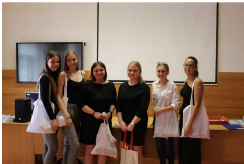
Soutěž můj pohled na práci Praktické sestry