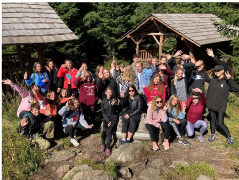
Seznamovací kurz 1. ročníků – Kouty nad Desnou