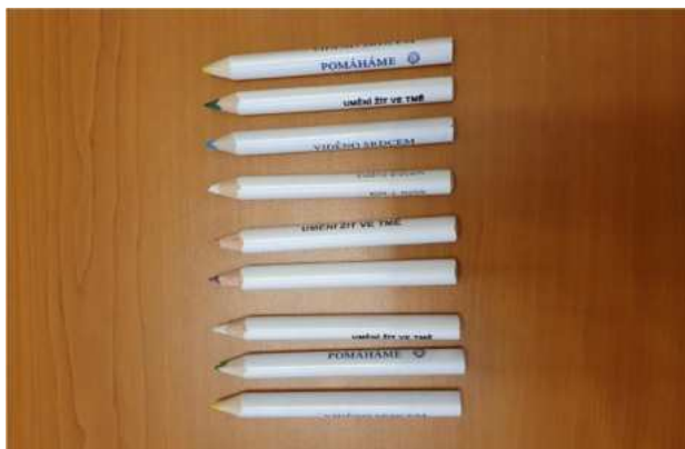
Sbirka Bílá pastelka

Během celého školního roku probíhá projekt „Prohloubení kvality vzdělávání na SZŠ Šumperk II“, CZ.02.3.X/0.0/0.0/18_065/0013803, který v rámci jedné šablony umožňuje žákům prohlédnout různá zdravotnická či sociální pracoviště v našem regionu. Ve spolupráci s budoucími zaměstnavateli formou workshopů a přednášek odborníků z praxe žáci získávají informace z reálného prostředí, které pak využijí při výběru svého zaměstnavatele. Vzhledem k tomu, že praxe v zdravotnických a sociálních zařízeních byla povolena po celou dobu školního roku, mohla tato aktivita probíhat ve velmi těsné spolupráci s těmito zařízeními. Vždy za respektování aktuálních hygienických nařízení. Projektové období jsme prodloužili do února 2022, abychom mohli dokončit projektové dny, které nemohly být realizovány.