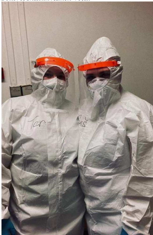
Jesenická nemocnice covid jednotka

Celý školní rok se nesl v duchu okamžitých reakcí na časté změny v nařízeních a vládních opatření. Nejdůležitější strategií bylo zaměření se na vědomosti a dovednosti, které žáci musí získat, aby jejich klíčové a odborné kompetence odpovídaly profilu Zdravotnického asistenta či Praktické sestry.