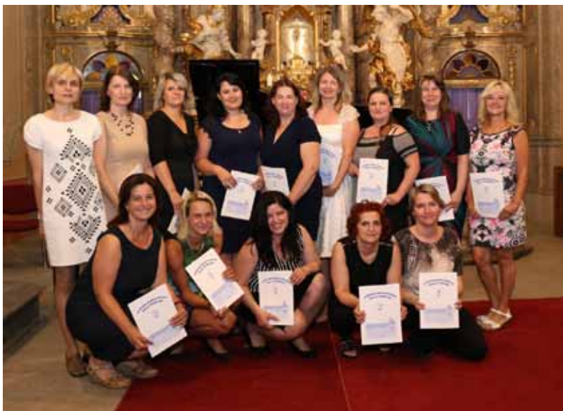
Třída ZA 5. C-večerní studium