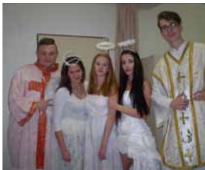
Naši žáci v podobě Mikuláše, čerta a anděla v Nemocnici Šumperk

Zapojením našich žáků do dobrovolných sbírek se snažíme o motivaci žáků k nezištné pomoci ostatním a k rozvoji altruismu, vlastnosti nezbytné pro práci zdravotníka. Účastnili jsme se sbírek: charitativní akce Bílá pastelka, humanitární sbírka Srdíčková den, Vánoční hvězda, sbírka plastových víček.....).