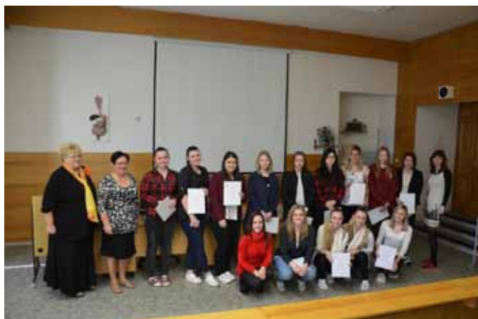
Olympiáda z psychologie – školní kolo

Do Olympiády z psychologie byli zapojeni žáci 2., 3. i 4. ročníků. Vítězky nás reprezentovaly v krajském kole v Prostějově, kde vystoupaly na stříbrnou příčku.