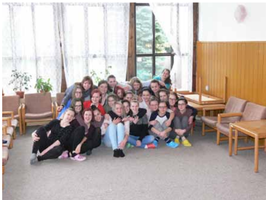
Čtvrtáčky se loučí