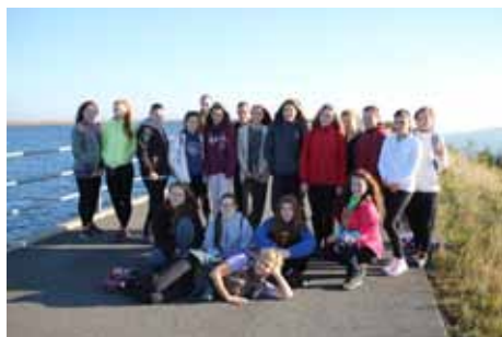
Seznamovací kurz 1. ročníků

72% žáků pozitivně zhodnotilo prostředí , kde akce probíhala a 58% žáků by seznamovací kurz doporučilo budoucím žákům 1. ročníků. Mezi nejoblíbenější a nejlepší aktivity zařadili žáci diskotéku a společenské hry. Nejméně oblíbenými činnostmi byly ekologické aktivity , které 53% přítomných žáků zhodnotilo tak, že by danou aktivitu již nechtěli opakovat. Mezi další méně oblíbené aktivity patřila turistika, kterou negativně zhodnotila asi jedna čtvrtina žáků, a to především z důvodu brzkého ranního vstávání.