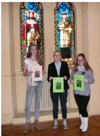
Účastnice soutěže ze somatologie v Olomouci.