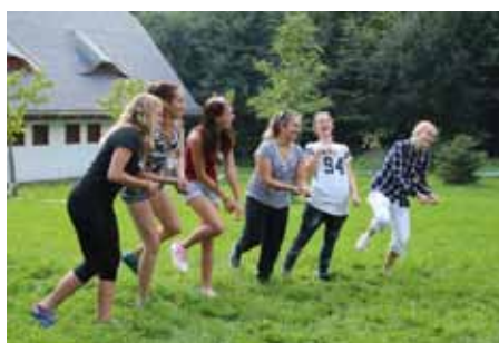
Seznamovací kurz 1. ročníků Švagrov

Vyučující tělesné výchovy se každým rokem snaží zařadit co možná nejméně náročnou a krátkou trasu, ale i přesto se stále setkáváme s nespokojeností žáků, neboť obecně nemají rádi činnost, která vyžaduje zvýšený pohyb. Vzhledem k tomu, že jsme si vědomi významu pohybu pro zdraví člověka, budeme turistiku do seznamovacích kurzů nadále zařazovat.