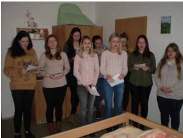
Besídka 2.B na Interně Záběh s.r.o.