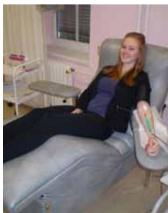
Dobrovolné dárcovství krve našich žáků