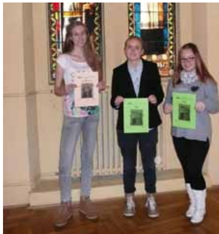
Somatologické dny v Olomouci

Vítězové školního kola poté postoupili do oblastní soutěže s názvem „Somatologické dny“ pořádané na SZŠ a VOŠZ v Olomouci.