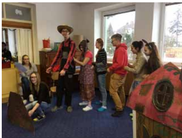
Besídka 3.B v ZŠ, MŠ a SŠ - Hanácká 3, Šumperk.

Spolupracujeme s různými sociálními zařízeními, kde jsme realizovali vánoční besídky a odborné stáže. Jsou to tato zařízení: Základní škola a střední škola Pomněnka o.p.s., Domov Paprsek Olšany, Schola Viva Šumperk, Interna Zábřeh s.r.o., Dětské centrum Ostrůvek Šumperk, ZŠ, MŠ a SŠ - Hanácká 3, Šumperk.