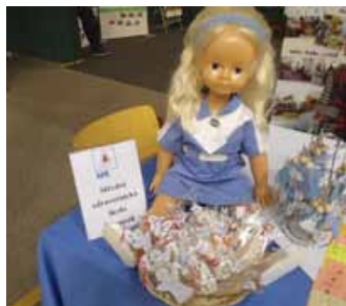
Prezentační výstavy Jeseník, Šumperk a Olomouc

VP navázala kontakty s výchovnými poradci mnoha základních škol , kteří nám umožnili navštívit žáky 9. ročníků přímo ve vyučování nebo na rodičovském sdružení. Žákům byla nejen představena naše škola a obor Zdravotnický asistent, ale byl ponechán prostor pro besedu s žáky na téma zdraví, nemoc, schopnost empatie a význam mezilidských vztahů. Podařilo se nám navštívit ZŠ Postřelmov, Bludov, Šumperk, Mohelnice, Hanušovice, Zábřeh, Uničov, Ruda nad Moravou a Litovel.