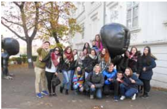
Projektový týden v Praze

Cíl projektového týdne byl nejen vzdělávací, výchovný, ale také motivační se snahou podnítit v žácích zájem o práci ve zdravotnictví.