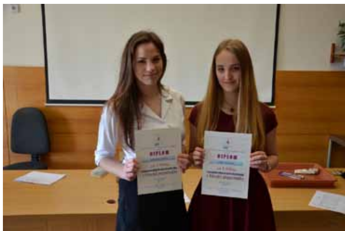
Vítězka školního kola z Klinické propedeutiky