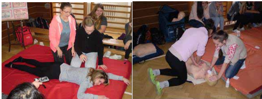
Pracovní setkání žáků naší školy s nácvikem postupů první pomoci

Po této přípravě následovaly kurzy první pomoci pro veřejnost ve třech termínech 9. února, 16. února a 23. února 2017, vždy ve čtvrtek od 16 hodin do 18 hodin. Zaznamenali jsme celkem 244 návštěv, s účastníky jsme nacvičovali postupy první pomoci vždy na 4 stanovištích. Na organizaci kurzů pro veřejnost se podílely ve funkci školitelů 4 odborné učitelky a zejména naši žáci, kteří byli připraveni na roli školitelů, figurantů a pomocníků na předcházejících pracovních setkáních v celkovém počtu 56 žáků.