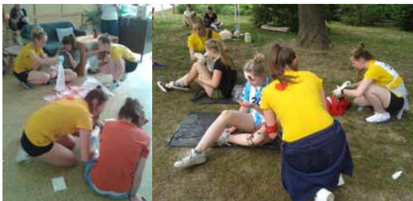
Celostátní soutěž první pomoci v Brně modelové situace

V této kategorii soutěžilo 24 družstev a naše družstvo obsadilo 5. místo.