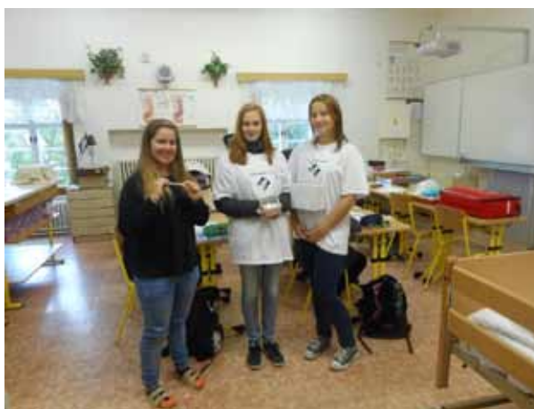
Sbírka Bílá pastelka