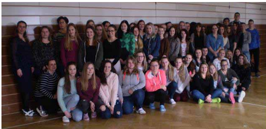
Část realizačního týmu Kurzy první pomoci 2017

Nejdříve proběhla pracovní setkání žáků ve třech termínech 1. února, 15. února a 22. února 2017. Po jednotlivých pracovních setkáních následovaly kurzy první pomoci pro veřejnost. Tato setkání se uskutečnila v budově naší školy – v tělocvičně. Akce se zúčastnilo celkem 78 žáků. Žáci se zde zdokonaľovali v postupech první pomoci. Pracovali jsme vždy na 4 stanovištích se zaměřením na KPR, bezvědomí a péči o zraněného v bezvědomí, obvazovou techniku, postupy zástavy krvácení a ošetření zlomenin.