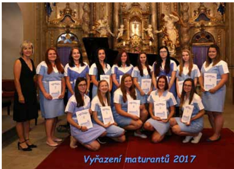
Třída ZA 4. A