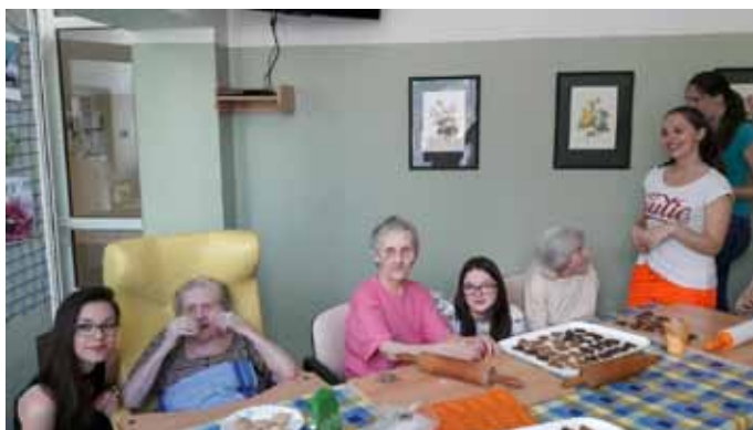
Pečovatelský kroužek v Nemocnici Šumperk

Naším dlouhodobým cílem je rozvíjet žáky ve všech oblastech, motivovat je ke zdravotnické profesi, a proto každoročně připravujeme studentské konference z odborných předmětů pro žáky všech ročníků. V prvním ročníku jsme uskutečnili soutěž ze somatologie, vítězné družstvo se zúčastnilo Somatologických dnů v Olomouci. Ve druhém ročníku proběhla soutěž z Klinické propedeutiky. Letošní 4. ročník proběhl stejně jako loni i na mezinárodní úrovni. Do soutěže se zapojili žáci z Bratislavy, Hranic, Olomouce, Prostějova, Zlína, Šumperka a nově z Českých Budějovic. Jako host se přijela podívat kolegyně z Třebíče, která velmi ocenila vizi soutěže a přislíbila účast v dalším ročníku. Naši žáci obstáli v mocné konkurenci a obsadili zlatou příčku.