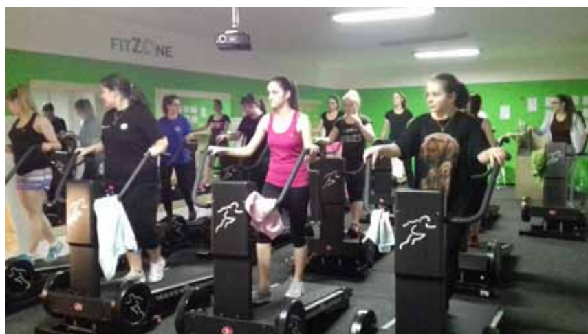
Návštěva sportovního centra HEAT