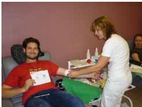
Společné darování krve na Transfúzní službě v Šumperku

I v letošním roce jsme vypracovali srovnávací testy 3. ročníků a 4. ročníků z ošetřovatelství. Hodnocení je srovnatelné se studijními výsledky žáků za 1. pololetí.