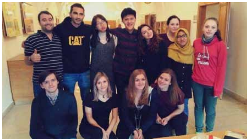
Projekt Edison na naší škole

V průběhu školního roku 2016/17 se nám podařilo dvakrát zorganizovat dobrovolné dárcovství krve plnoletých žáků 3. a 4. ročníků. Každoročně se snažíme žáky k dárcovství motivovat, vést je k odpovědnosti za vlastní život i životy druhých. Dárcovství se zúčastnili nejen pravidelní dárci, ale podařilo se motivovat i prvodárce.