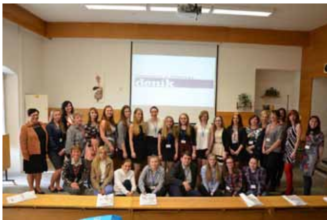
Studentská konference z Klinické propedeutiky celorepublikové kolo s mezinárodní účastí

Pro žáky třetích a čtvrtých ročníků jsme zorganizovali soutěž z Ošetřovatelství „Moje nejzajímavější kasuistika“. Žákyně, která se umístila na 1. místě, uhájila své vítězství na XIII. Festivalu ošetřovatelských kasuistik ve Zlíně. Nejlepší žáci druhých ročníků se také zúčastnili soutěže První pomoci v Brně, kde se žáci umístili na krásném 5 místě.