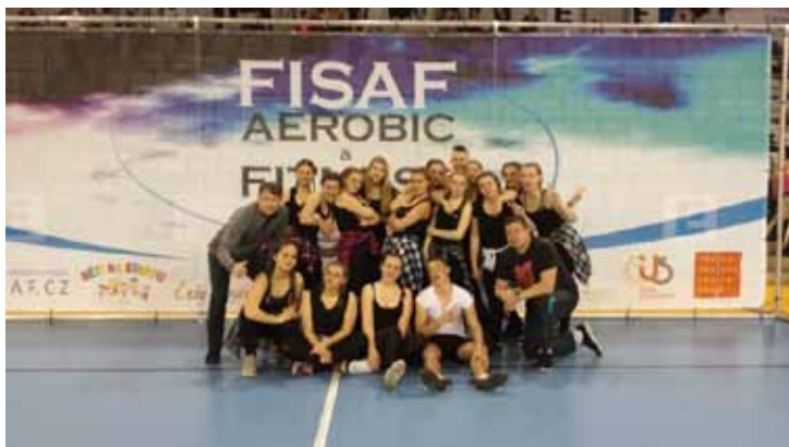
Soutěž Česko se hýbe ve školách plných zdraví

Pohybové a taneční schopnosti žáků byly rozvíjeny v taneční soutěži jednotlivých tříd. Vítězná třída žáků 1.B postoupila do oblastního kola soutěže s názvem „ Česko se hýbe ve školách plných zdraví “ (vyhlášené MŠMT), která se uskutečnila 20. 04. 2017 v Praze a na které se naši žáci umístili na 5. místě .