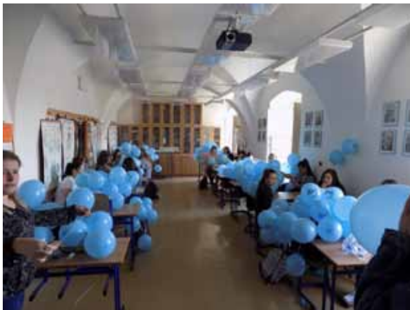
Světový den porozumění autismu

Naším dlouhodobým cílem je motivovat žáky k angažovanosti pro veřejné zájmy společnosti. Aktivně jsme se zúčastnili čtyř humanitárních sbírek - Bílá pastelka, Vánoční hvězda sdružení Šance, Srdíčkové dny - Život dětem, o.p.s, Liga proti rakovině. Nabízením modrých balonků jsme také podpořili Světový den porozumění autismu.