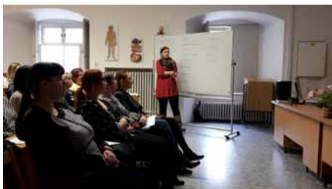
Konferenci pro zdravotnické pracovníky nelékařských profesí