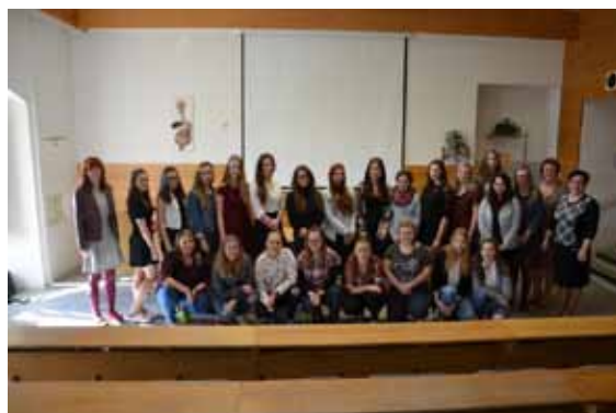
Skolní kolo studentské konference z Klinické propedeutiky a Somatologie

Naším dlouhodobým cílem je rozvíjet žáky ve všech oblastech, motivovat je ke zdravotnické profesi, a proto každoročně připravujeme studentské konference z odborných předmětů pro žáky všech ročníků. V prvním ročníku jsme uskutečnili soutěž ze somatologie, vítězné družstvo se zúčastnilo Somatologických dnů v Olomouci. Ve druhém ročníku proběhla soutěž z Klinické propedeutiky. Letošní 4. ročník proběhl stejně jako loni i na mezinárodní úrovni. Do soutěže se zapojili žáci z Bratislavy, Hranic, Olomouce, Prostějova, Zlína, Šumperka a nově z Českých Budějovic. Jako host se přijela podívat kolegyně z Třebíče, která velmi ocenila vizi soutěže a přislíbila účast v dalším ročníku. Naši žáci obstáli v mocné konkurenci a obsadili zlatou příčku.