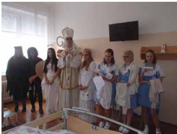
Mikuláš v Nemocnici Šumperk

Také jsme se zapojili do akcí společně s Transfúzní stanicí Šumperk, která je součástí skupiny Agel – Společné darování krve.