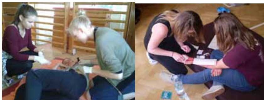
Soutěž první pomoci pro 2. ročníky

Mezi aktivity kroužku můžeme zahrnout i každoročně organizovanou soutěž první pomoci na naší škole. Soutěže se celkem zúčastnilo 40 žáků 2. ročníku, kteří byli rozděleni do deseti družstev. Družstva soutěžila na dvou stanovištích. Na každém ze stanovišť byli tři zranění. Všem žákům, kteří navštěvují kroužek první pomoci, se podařilo zúročit své znalosti a dovednosti a v soutěži si vedli velice dobře. Většina členů kroužku první pomoci v této soutěži zastávalo funkci velitelů družstev. Organizačně nám při školním kole soutěže první pomoci vypomohly žákyně 1. ročníku – členky kroužku první pomoci, které působili ve funkci figurantů i rozhodčích.