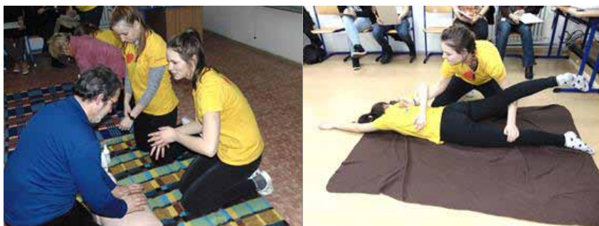
Kurzy první pomoci pro veřejnost 2017

Po této přípravě následovaly kurzy první pomoci pro veřejnost ve třech termínech 9. února, 16. února a 23. února 2017, vždy ve čtvrtek od 16 hodin do 18 hodin. Zaznamenali jsme celkem 244 návštěv, s účastníky jsme nacvičovali postupy první pomoci vždy na 4 stanovištích. Na organizaci kurzů pro veřejnost se podílely ve funkci školitelů 4 odborné učitelky a zejména naši žáci, kteří byli připraveni na roli školitelů, figurantů a pomocníků na předcházejících pracovních setkáních v celkovém počtu 56 žáků.