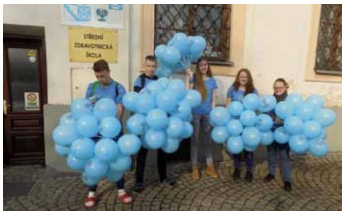
Mezinárodní den autismu

Třída 1.A byla zapojena do „ Mezinárodního dne autismu “. Prostřednictvím rozdávání balonků a letáčků pomohli naši žáci zvýšit vědomí občanů o autismu.