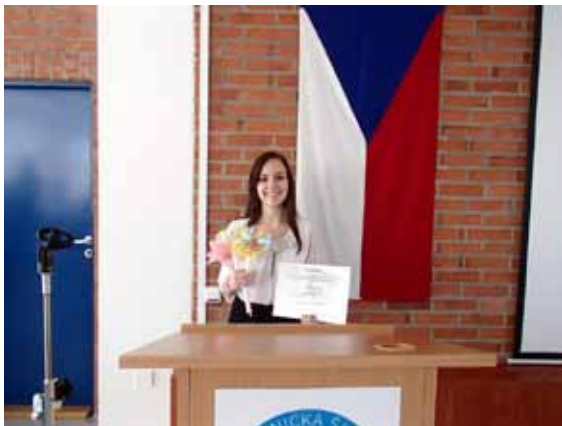
Absolutní vítězka XIII. festivalu Ošetrovatelských kazuistik ve Zlíně

1. a 2. ročníky se zúčastnily školního kola soutěže Matematický klokan – kategorie Junior. Někteří žáci s vynikajícími výsledky ve školních kolech se zúčastnili kol okresních.