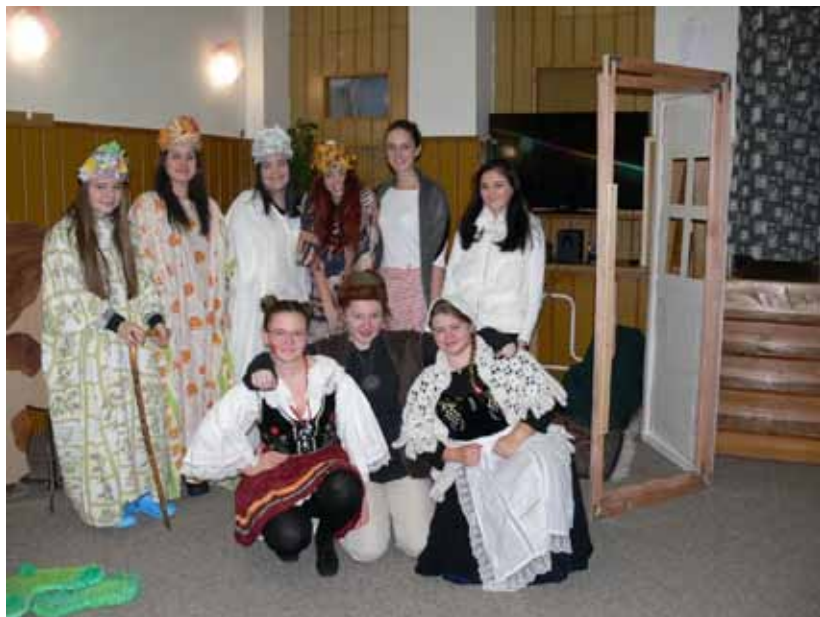
Pohádka „O čtyřech ročních obdobích“