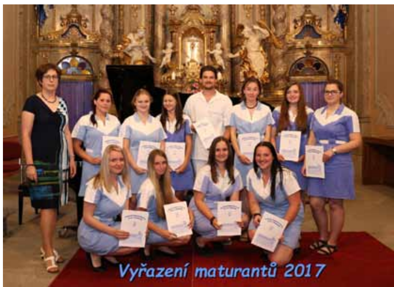
Třída ZA 4. B