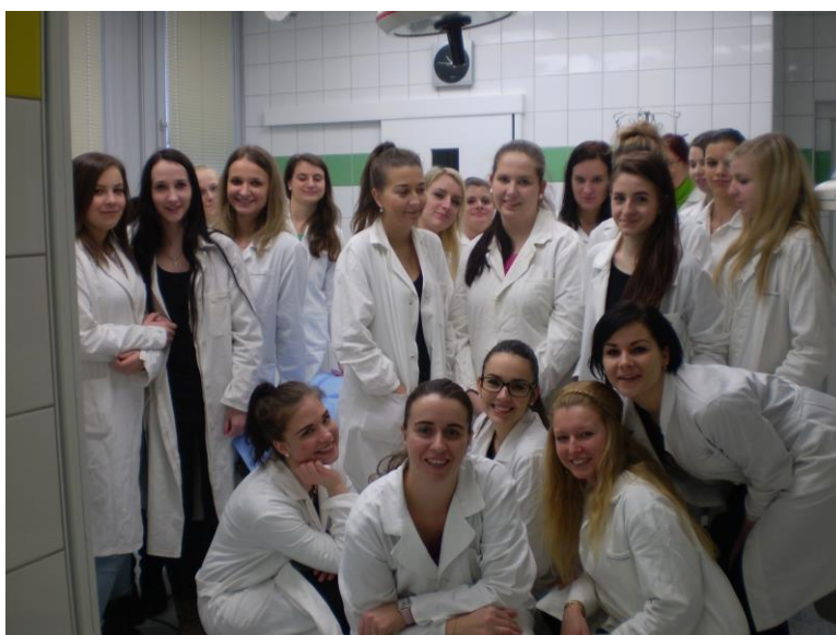
Odborná exkurze FN Motol

K rozvoji odborných kompetencí byly rovněž zařazeny exkurze v zdravotnických a sociálních zařízeních.