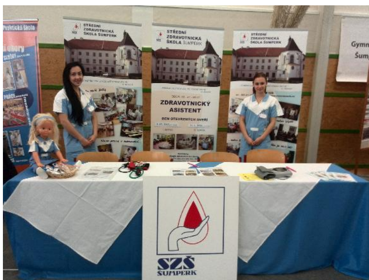
Prezentační výstava Scholaris 2015 Šumperk

V tomto školním roce uspořádala tak jako loni burzu škol i základní škola Mohelnice, na které jsme rovněž měli možnost se představit. Výstavy jsou pro nás významnou příležitostí, na které můžeme žákům základních škol co nejvíce přiblížit studium oboru Zdravotnický asistent a uplatnění na trhu práce. Žáci základních škol, jejich rodiče, učitelé a výchovní poradci získávají informace nejen od pedagogů naší školy, ale také přímo od žáků, kteří každoročně prezentují školu v sesterských uniformách.