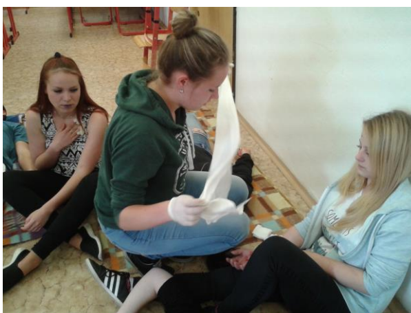
Soustředění kroužku první pomoci