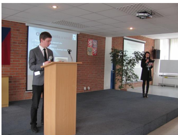
XII. festival Ošetrovatelských kazuistik ve Zlíně

Ze školního kola soutěže s názvem „Ošetrovatelská kazuistika“ postoupila vítězná dvojice žáků 4. ročníku na XII. festival ošetrovatelských kazuistik, který se koná každoročně na SZŠ a VOŠZ ve Zlíně. Soutěže se účastnilo deset zdravotnických škol. Naši žáci si opět odvezli přední ceny, a tím bylo 1. místo od studentské poroty a 2. místo od odborné poroty.