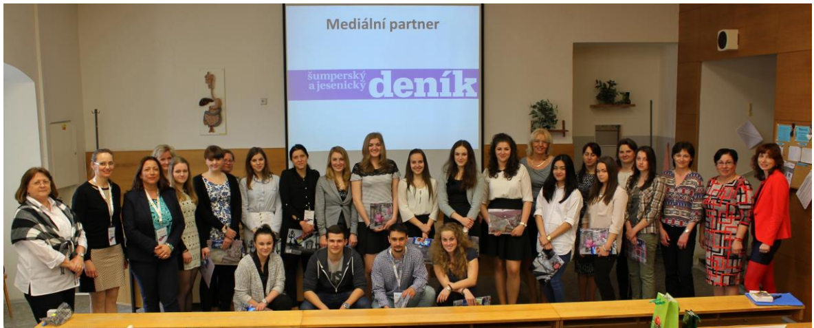
Mezinárodní soutěž z Klinické propedeutiky – všichni účastníci