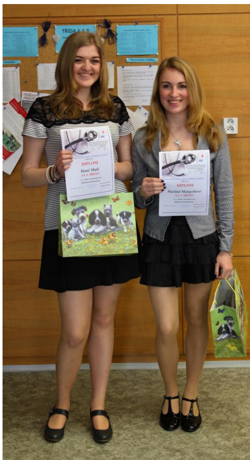
Vítězky mezinárodní soutěže z KLP

Pro žáky třetích a čtvrtých ročníků se uskutečnila soutěž z Ošetřovatelství „Moje nejzajímavější kasuistika“. Žáci, kteří se umístili na 1. a 2. místě, obhájili své vítězství na XII. Festivalu ošetřovatelských kasuistik ve Zlíně. Nejlepší žáci druhých a třetích ročníků se také zúčastnili soutěže První pomoci s mezinárodní účastí v Brně, kde se ve výrazné konkurenci umístilo družstvo ze třetího ročníku na 6. místě a družstvo ze druhého ročníku na 9. místě.