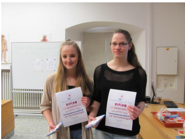
Vítězové školního kola soutěže ze Somatologie propedeutiky

Žáci 1. ročníků se zúčastnili soutěže s názvem „Somatologický den“, který pořádá SZŠ a VOŠZ Olomouc. V březnu 2016 se uskutečnilo školní kolo soutěže ze Somatologie a Klinické propedeutiky. Nejlepší žáci postoupili do krajských kol.