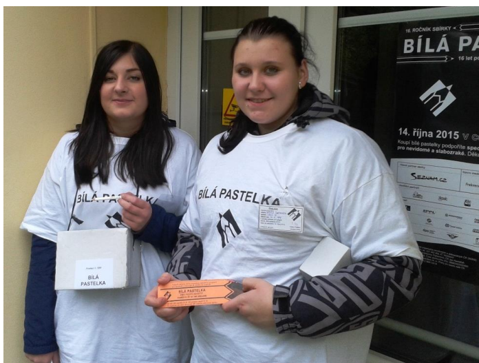
Sbírka Bílá pastelka

V rámci mezipředmětových vztahů a průřezových témat se aktivně zapojujeme do EVVO.