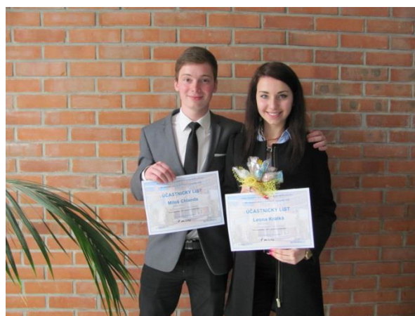
Úspěch našich žáků - 1. a 2. místo