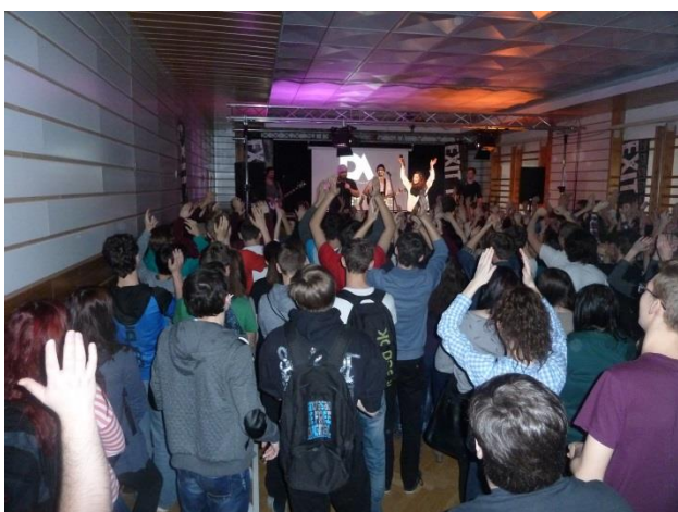
Koncert rockové kapely – akce EXIT TOUR

V březnu 2016 proběhla celoškolská akce v rámci prevence s názvem EXIT TOUR . Akci jsme zajišťovali a organizovali spolu se školní metodičkou prevence. Pro 1. ročníky jsem vybrala téma Kyberšikana (nebezpečí internetu) a Moderní je nekouřit (nebezpečí kouření). 2. ročníky absolvovaly přednášky Pornografie a kult těla a dále Život v závislostech. Pro 3. ročníky bylo vybráno téma Rasismus, neonacismus a xenofobie, Prostituce a promiskuita. Vzdělávací preventivní program byl celodenní a začínal pro všechny žáky společně, a to vystoupením rockové kapely. Žáci byli koncertem dobře naladěni a motivováni. Současně jim byli představeni všichni lektori. Po ukončení akce jsme pro získání zpětné vazby zadali žákům vyplnění dotazníků k jednotlivým přednáškám, které absolvovali. Většina přednášek byla hodnocena jako přínosná. Pouze 2. ročníky zhodnotily negativně téma Pornografie a kult těla, a to především z důvodu pojetí přednášky ze strany lektorky, která je nezaujala obsahem přednášky ani svým vystupováním. Problém jsme poté diskutovali s organizátory akce, aby se podobná situace již neopakovala.