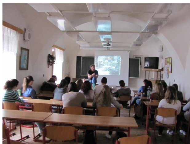
Přednáška na téma Život v závislostech