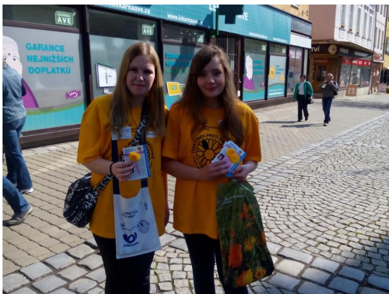
Liga proti rakovině

V oblasti vzdělávání jsme na naší škole uskutečnili odbornou konferenci pro nelékařské zdravotnické profese na téma: „Péče o duševní zdraví a stigmatizace.“ pod záštitou Národního ústavu duševního zdraví Praha. S Národním ústavem jsme rovněž spolupracovali na projektu MINDSET: Destigmatizační seminář pro střední zdravotnické školy. Jednalo se o unikátní výzkum, závěry a poznatky budou implementovány do reformy psychiatrické péče.