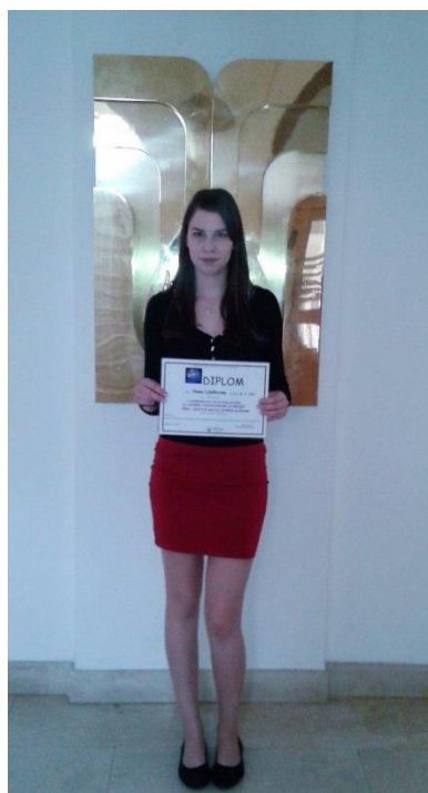
Vítězka celostátního kola

Vítězové školního kola soutěže v anglickém jazyce postoupili do 5. ročníku regionální soutěže středních škol s názvem „ Search it “. Žák 2. ročníku obsadil 1. místo v okresním kole a postoupil tak do krajského kola v Olomouci. Významného úspěchu dosáhla žákyně 4. ročníku, která získala 1. místo ve školním kole studentské soutěže „ Psychologická olympiáda “. Postoupila do krajského kola, které se konalo na SŠSP v Zábřehu, kde rovněž zvítězila. Celostátní kolo se konalo na SZŠ a VOŠZ v Kladně. Zde naše studentka obhájila výsledek školního a krajského kola a tím dosáhla nejvyššího úspěchu získání 1. místa v celostátním kole .