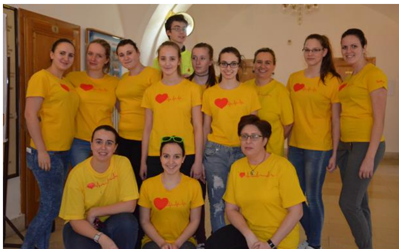
Kurzy první pomoci pro veřejnost 2016

Naše škola získala v kalendářním roce 2016 Dotaci města Šumperk pro neziskové akce na projekt První pomoc pro veřejnost 2016. Projekt se zaměřoval na předávání informací v poskytování první pomoci. Jeho cílem bylo zvyšování znalostí a dovedností v oblasti první pomoci u laické veřejnosti šumperského regionu.