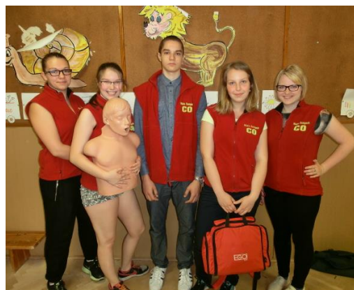
Ukázky první pomoci pro základní školy

V letošním školním roce jsme realizovali ukázky a nácvik první pomoci pro mateřské, základní a střední školy šumperského regionu. Z mateřských škol jsme byli nacvičovat první