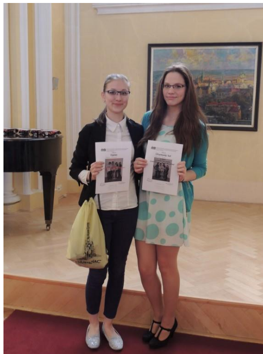
Účast na „Somatologickém dni“