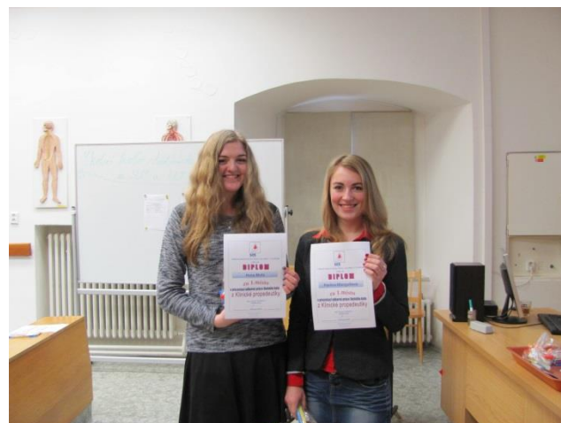
Vítězové soutěže z Klinické propedeutiky

Ze školního kola soutěže s názvem „Ošetrovatelská kazuistika“ postoupila vítězná dvojice žáků 4. ročníku na XII. festival ošetrovatelských kazuistik, který se koná každoročně na SZŠ a VOŠZ ve Zlíně. Soutěže se účastnilo deset zdravotnických škol. Naši žáci si opět odvezli přední ceny, a tím bylo 1. místo od studentské poroty a 2. místo od odborné poroty.