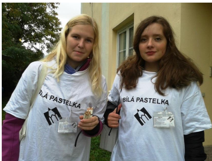
Sbírka Bílá pastelka

pro MŠ, domov důchodců, dětský domov a další zařízení, sbírky: Bílá pastelka, Vánoční hvězda, Liga proti rakovině, sbírka plastových víček.....).